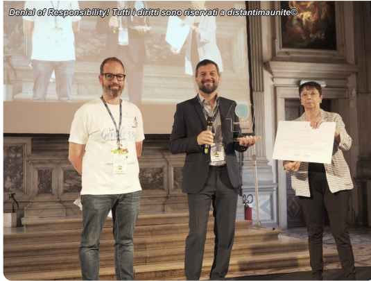
Conai – Consorzio Nazionale Imballi, con il progetto "Ciak, si gira, azione! Riciclare" realizzato ...