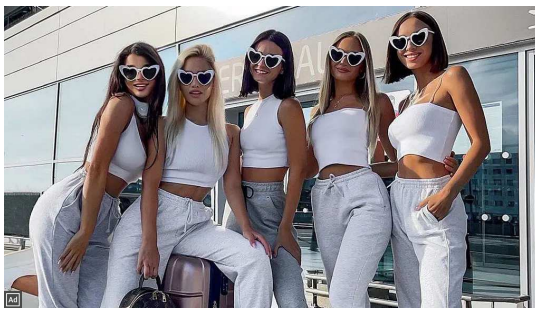
Comment Mercure rétrograde peut vous affecter selon votre signe BRAINBERRIES