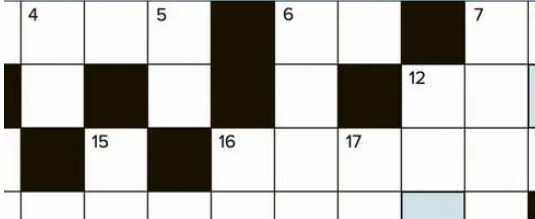
Fece crollare il tempio dei Filistei - Cruciverba